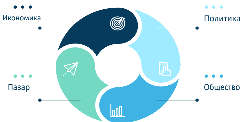
Фигура 1 Перспективите на биоикономиката